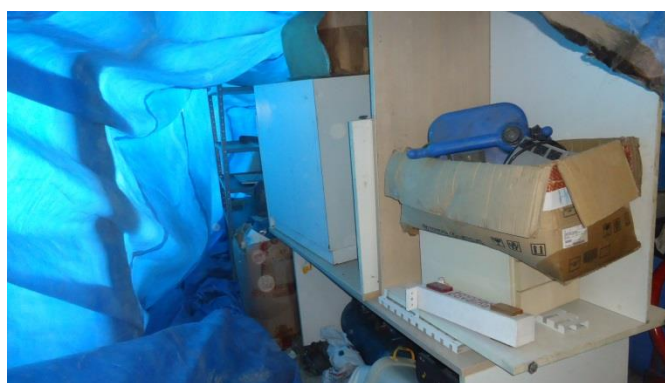
Moveis, Objetos e materiais sem utilização