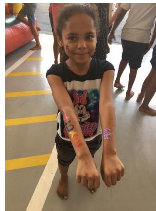
Crianças participando de pintura corporal