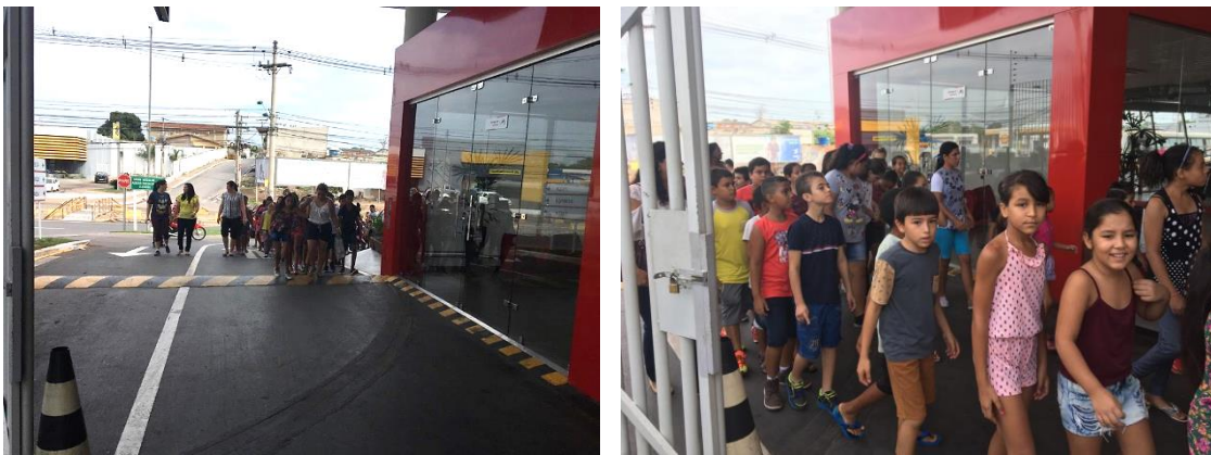
Crianças entrando na concessionária