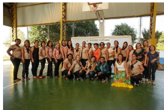
Secretária de Educação e Meio Ambiente Juntamente com a equipe de Docentes da Escola