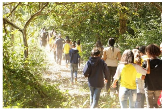
Alunos em caminho as margens do Rio