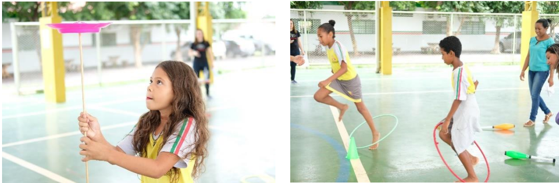
Crianças participando de Gincana Circense