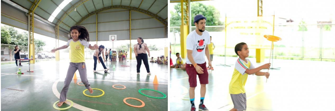
Crianças participando de Gincana Circense