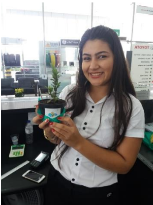
Colaboradora recebendo muda

Nesta primeira fase de aplicação do projeto atuamos dentro da concessionária, na semana do meio ambiente com a distribuição de mudas e conscientização de clientes e funcionários da necessidade de preservação do meio ambiente.