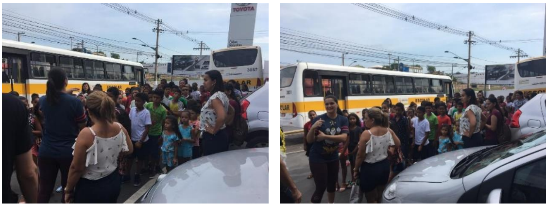
Crianças chegando a concessionária Orion Veículos de ônibus

Na terceira etapa levamos as crianças cuja salas preservaram e cuidaram de sua planta, para a concessionária, proporcionando uma manhã repleta de brincadeiras e interações. Tivemos pula-pula, toro mecânico, escorregador inflável, escalada inflável, futebol inflável, pintura, dança, gincana, pipoca, refrigerante, algodão doce e cachorro quente. Além disto distribuimos kits infantis contendo um quebra-cabeça personalizado com carros da marca Toyota.