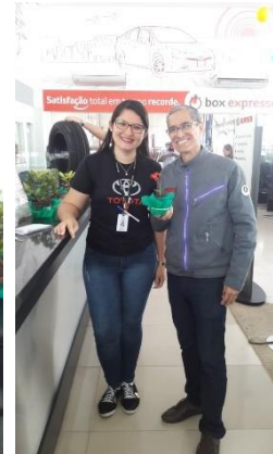
Cliente recebendo Muda