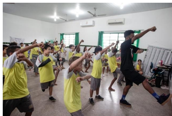
Crianças dançando na Oficina