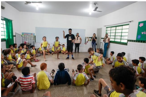
Professor orientando crianças da Oficina de Dança