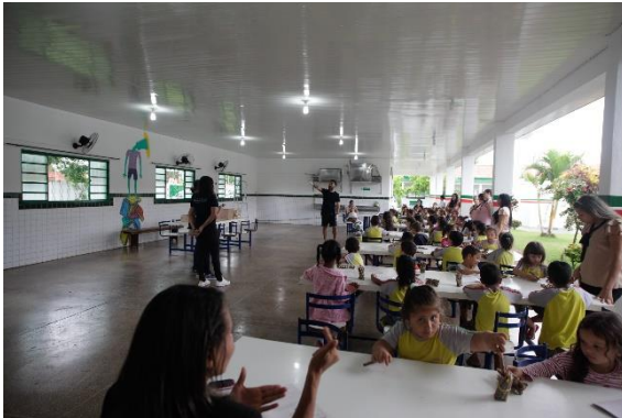
Artista explicando sobre arte

Artista plástico discursando para crianças sobre a importância da arte