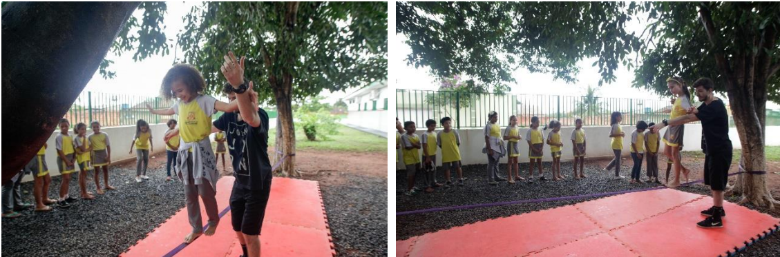
Crianças praticando Slackline