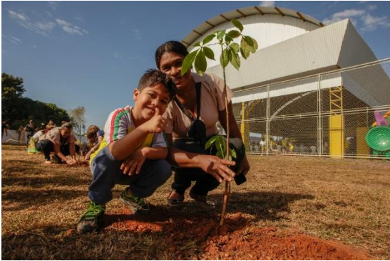
Aluno plantando árvore do compromisso de classe