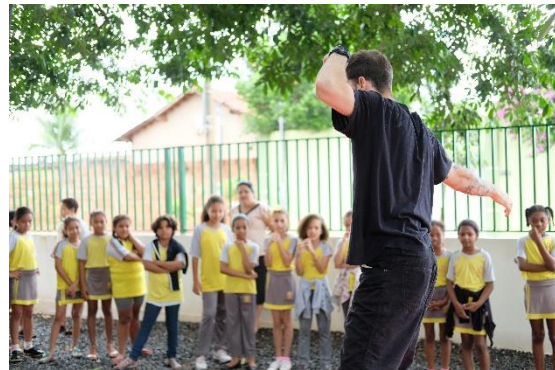
Professor de Slackline ensinando