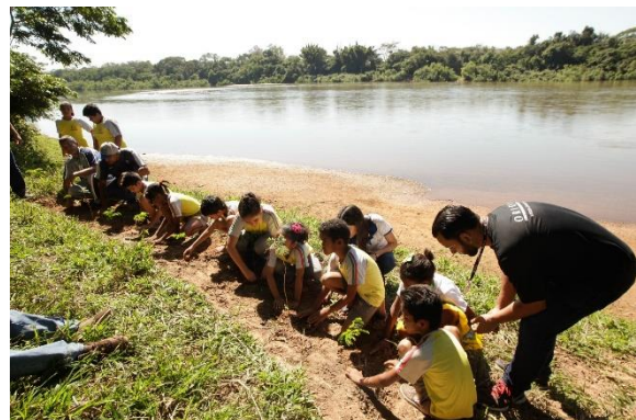
Equipe Orion Veículos e Crianças reflorestando às margens do Rio Cuiabá