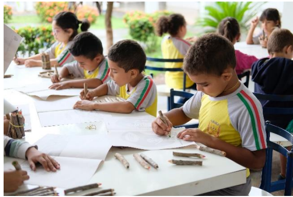
Crianças colorindo na oficina de pintura