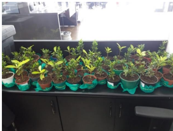
Mudas para distribuição