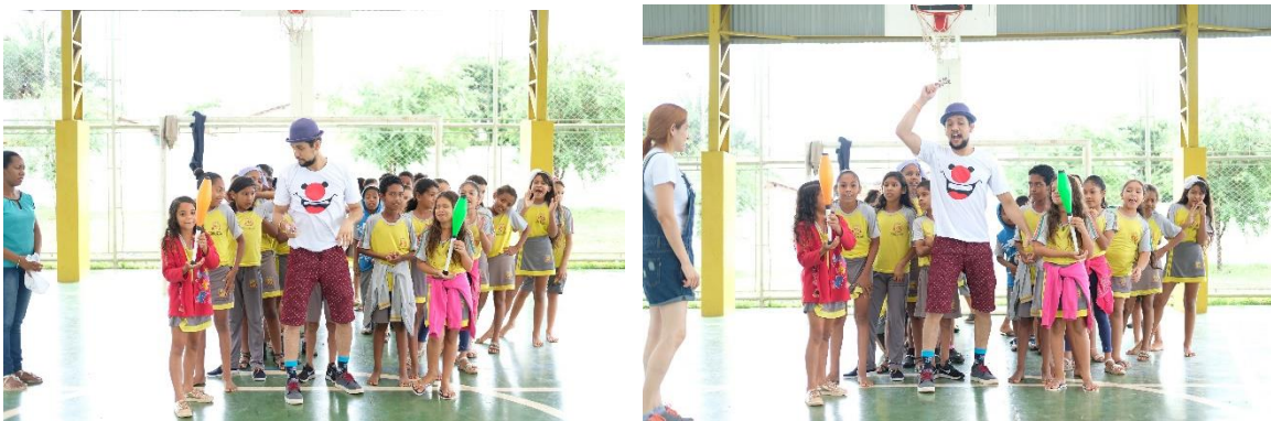
Crianças participando da oficina Circense

A arte circense incentiva crianças em diversos aspectos tais como: superação dos medos, socialização, espontaneidade, comunicação e desenvoltura, por estes aspectos trouxemos esta oficina, realizada pela equipe Circo Peregrino que desenvolvem diversos projetos tais como médicos da alegria no Hospital de Câncer de Mato Grosso e escola de arte circense.