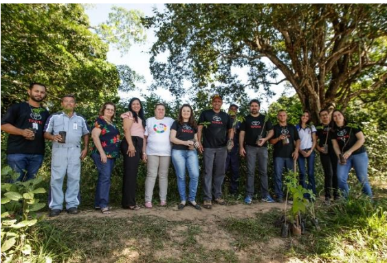
e Equipe Orion Veículos