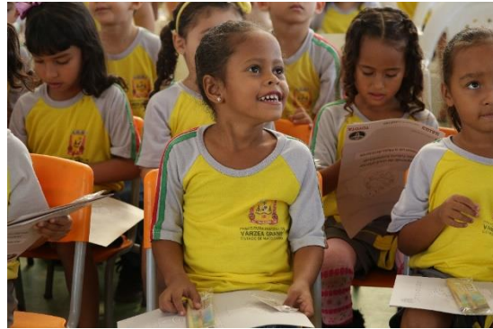
Alunos recebendo Kit