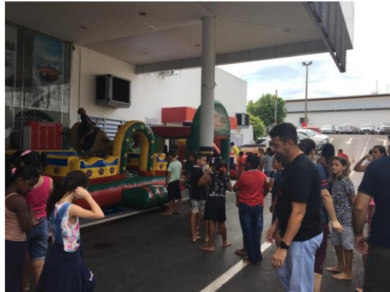
Crianças participando de atividades recreativas