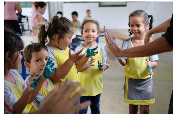
Crianças participando da pintura