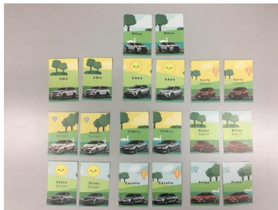
Jogo de memória personalizado Toyota