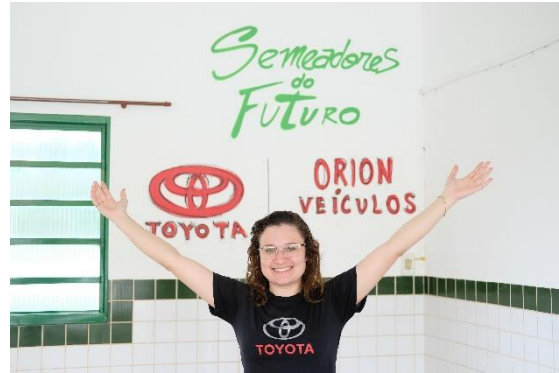
Arte finalizada em Refeitório