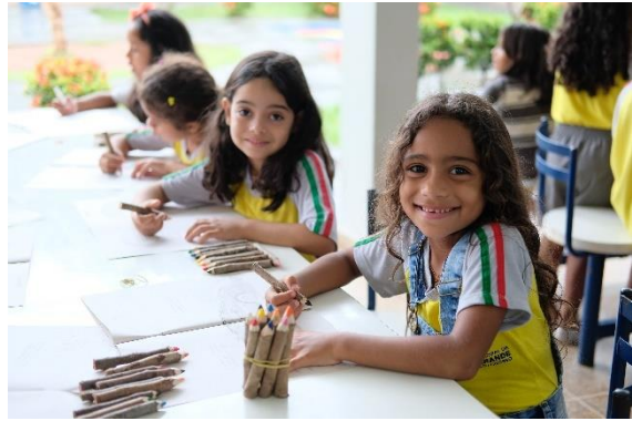
Crianças colorindo cartilha com lápis artesanal