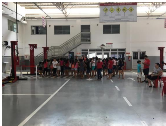
Crianças participando de atividades recreativas