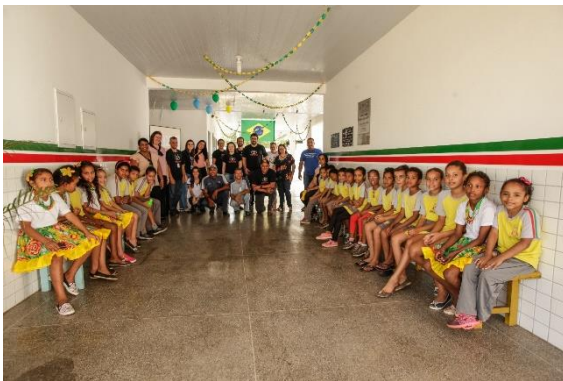
Alunos na comunidade de Bom Sucesso