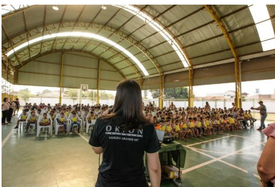
Alunos e comunidade reunida para palestras sobre preservação e conscientização do meio ambiente