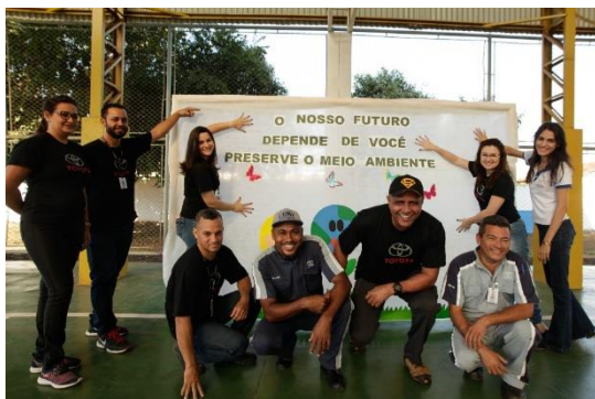
Equipe da Orion Veículos

semente modifica geneticamente que ao germinar em seu caule nasce a palavra Toyota escrita. Após a distribuição dos kits lançamos um desafio as turmas das escolas, cada turma adotaria e plantaria uma muda, em outubro voltaríamos a escola para a escolha das três árvores que estiverem mais bem cuidadas e como prêmio levaríamos as três classes para a concessionaria no dia das crianças para participarem de atividades recreativas. Após o lançamento do desafio, as crianças plantaram as mudas e fizeram o compromisso de cuidar. Lançamos este desafio com o intuito de aproximar as crianças da natureza e gerando a responsabilidade social e ambiental. Após o plantio das mudas as crianças e comunidade se deliciaram com cachorro quente, pipoca e refrigerante. A escola escolheu trinta alunos para realizar o plantio das mudas para reflorestamento das margens do rio Cuiabá. Saímos de ônibus até a comunidade de bom sucesso distrito de várzea grande com destino a escola municipal Benedito Rodrigues de Moraes para o plantio das mudas as margens do rio Cuiabá.