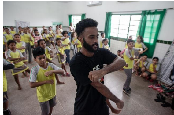
Crianças sendo ensinadas na Oficina de Dança pelo Professor