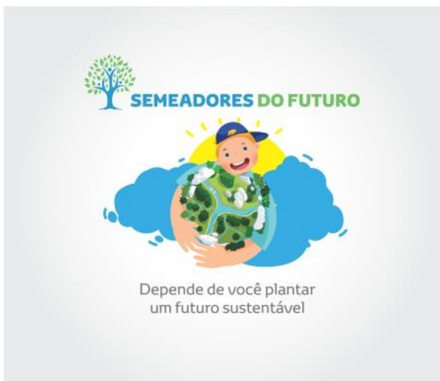
Logo do projeto

Unindo cores associadas com o meio ambiente, relacionadas à proteção da vida aquática e terrestre, a marca traz visualmente o cumprimento do que é prometido no nome do programa. Semeando hoje, teremos um amanhã com uma comunidade em harmonia, representada pelas pessoas unidas no caule, e uma natureza abundante, representada pelas folhas da copa.