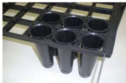
Bandejas e tubetes