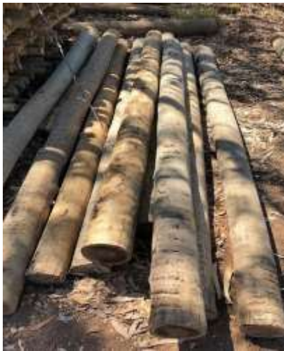
Madeira de reflorestamento

Os materiais utilizados para execução do projeto será a madeira de reflorestamento, tela de sombreamento (sombrites), bandejas, tubetes para cultivo das mudas, sementes de plantas nativas do cerrado, adubo, minhocário, parafusos, canos, torneiras, regador, mangueiras, composteira e aspersores de irrigação.