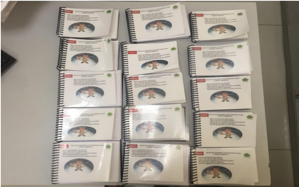
Bloquinhos de recado confeccionado com todo o papel coletado dentro da empresa;