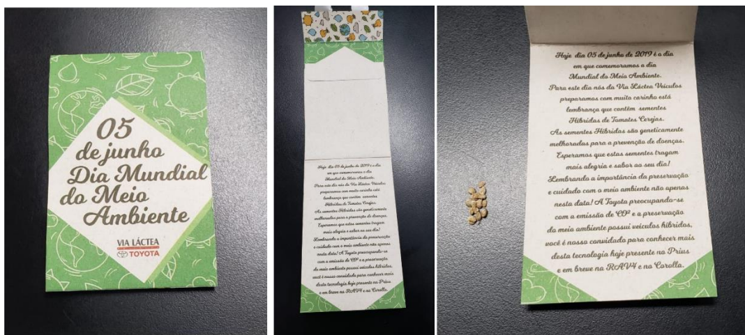
Envelope personalizado de papel reciclado com sementes híbridas

Distribuição de sementes híbridas de tomate cereja para clientes na concessionária. Nosso intuito além de levar conscientização sobre o plantio e sustentabilidade, gerando o próprio alimento, unimos a questão híbrido das sementes melhoradas geneticamente com alto vigor e produtividade para levar até os clientes a mensagem de melhoria constante e o convite aos nossos clientes para que conhecessem nossos veículos híbridos.