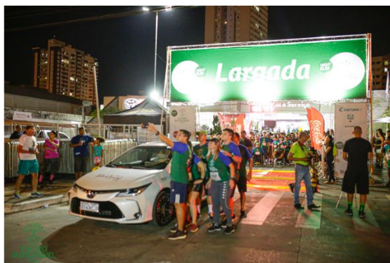
Concentração de atletas para corrida