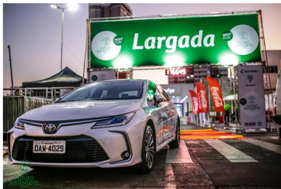
Exposição de carros híbridos RAV4 e Prius, como carro madrinha da corrida o Corolla híbrido