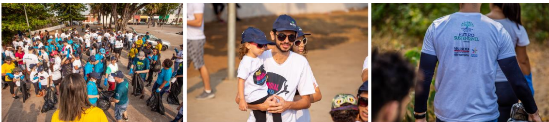
Concentração na Orla do Porto próximo as margens do Rio Cuiabá