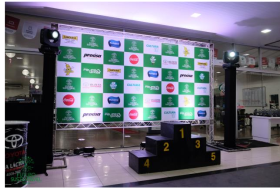
Estrutura da Corrida