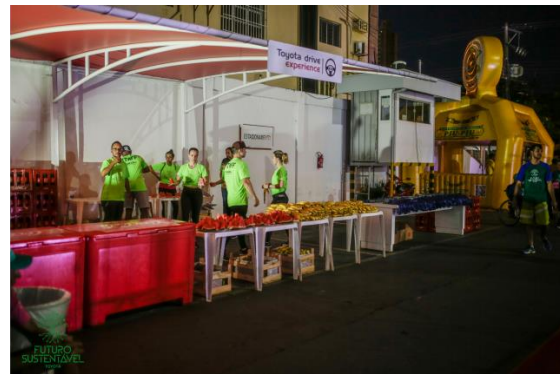
Espaço para reposição de energia, distribuímos bananas, melancia, powerade, água e coca-cola