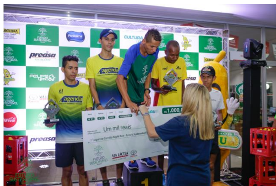
Premiação Geral de 1º a 5º colocados Feminino e Masculino