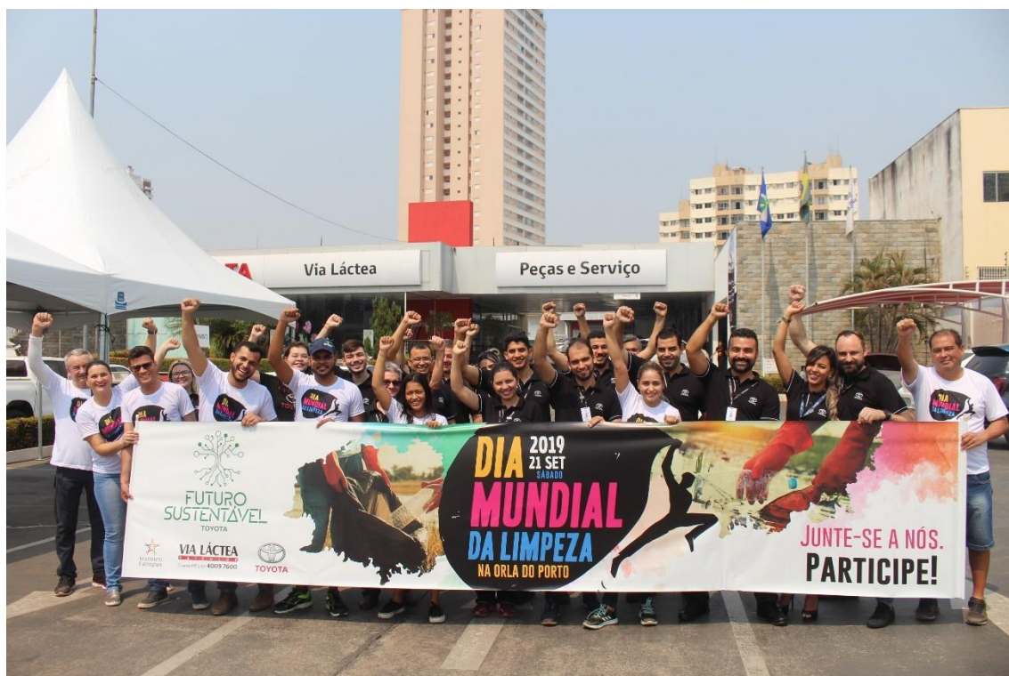
Concentração em Frente a Concessionária Via Láctea Veículos

Nossos colaboradores se voluntariaram para realização da retirada de lixos das margens do Rio Cuiabá, nossa concentração se iniciou em frente a concessionária Via Láctea Veículos.