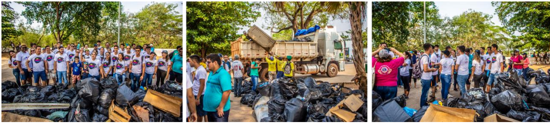
Retirada de duas toneladas de lixo das margens do Rio Cuiabá