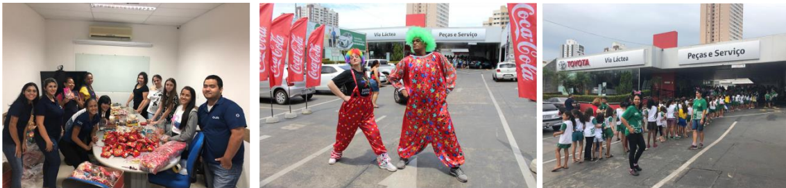
Funcionários Montando Kit para a ação / Funcionários engajados na ação / Crianças chegando na concessionária

Disponibilizamos brinquedos e muitas brincadeiras dentro do ambiente da concessionária, ao final distribuimos um kit com doces e guloseimas.