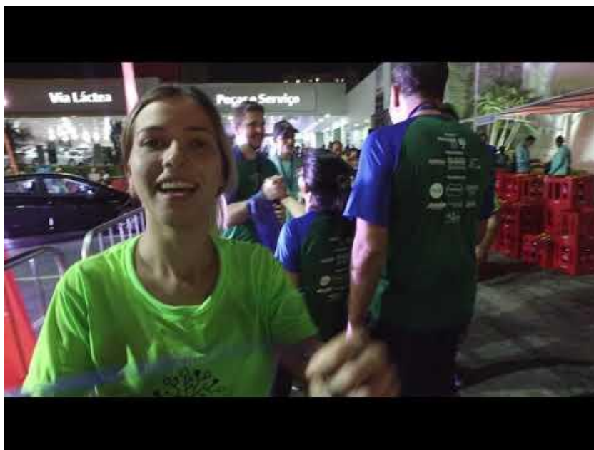
Vídeo da Ação

https://www.youtube.com/watch?v=6Yl_i7-hvFI&feature=youtu.be