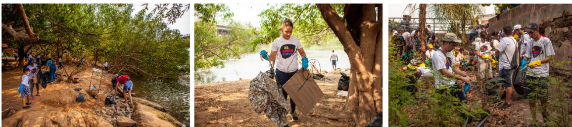
Recolhimento do lixo as margens do Rio Cuiabá