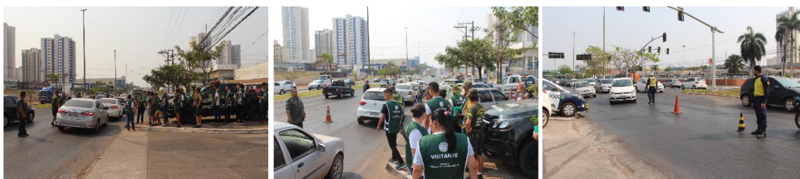
Concentração da ação em frente a concessionária para realização da blitz