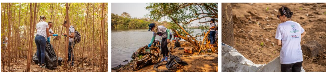
Recolhimento do lixo as margens do Rio Cuiabá