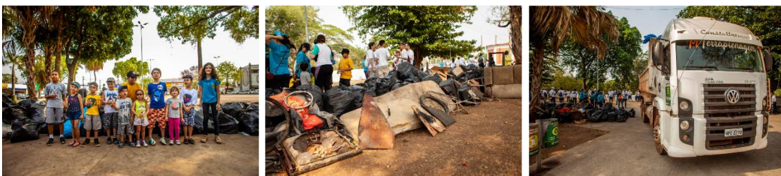
Até as crianças vieram ajudar, pois é de pequeno que se aprende a construir um mundo melhor!