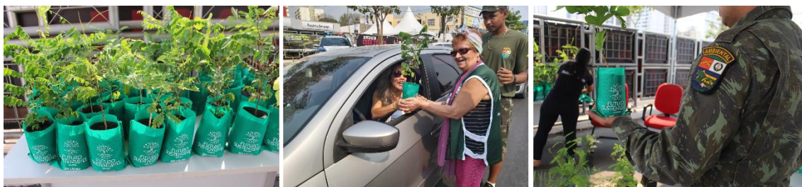
Distribuição de mudas para motoristas na Blitz Ecológica por um Futuro Sustentável