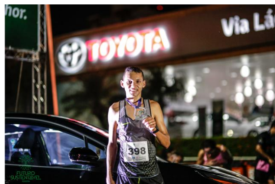
Chegada de Atletas