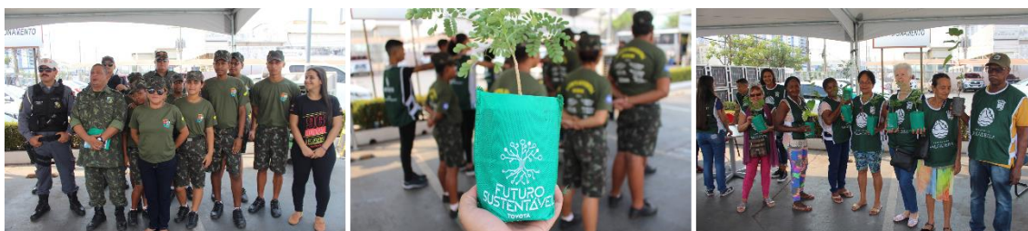
Concentração Equipe Policia Ambiental, Agentes Mirins e Idosos do Repouso Shallon

Além de levar a mensagem a clientes e população sobre a necessidade da preservação e sustentabilidade do planeta, nosso intuito também era proporcionar inclusão. Acreditamos que gerar felicidade não tem preço!