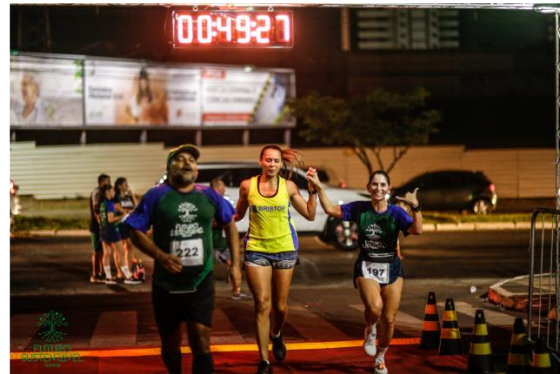
Atleta PNE em percurso e categoria geral na chegada