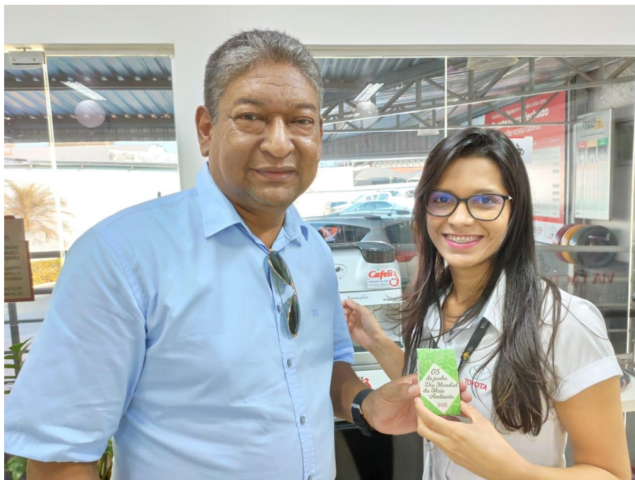
Cliente recebendo Sementes Híbridas em nossa concessionária