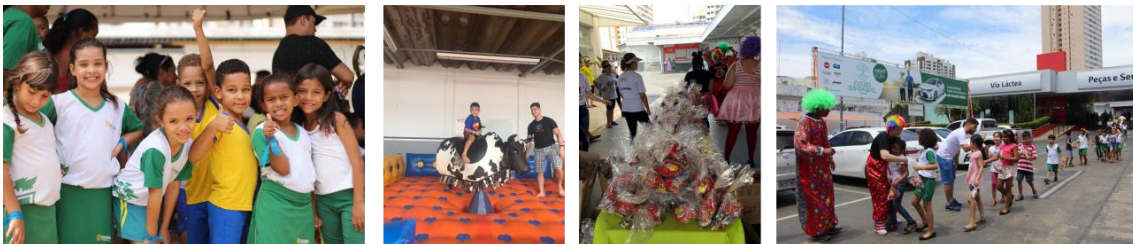
Crianças participando da ação e recebendo o kit na partida.