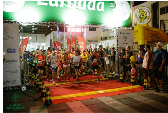
Largada da corrida categoria Geral