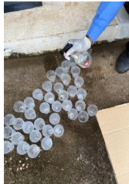
Ressignificação de copos descartáveis que foram usados na empresa. Higienizamos e usamos para plantar as sementes das hortaliças.