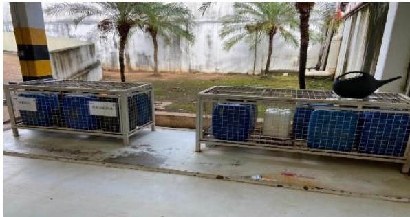
Local antes da horta ser implantada.