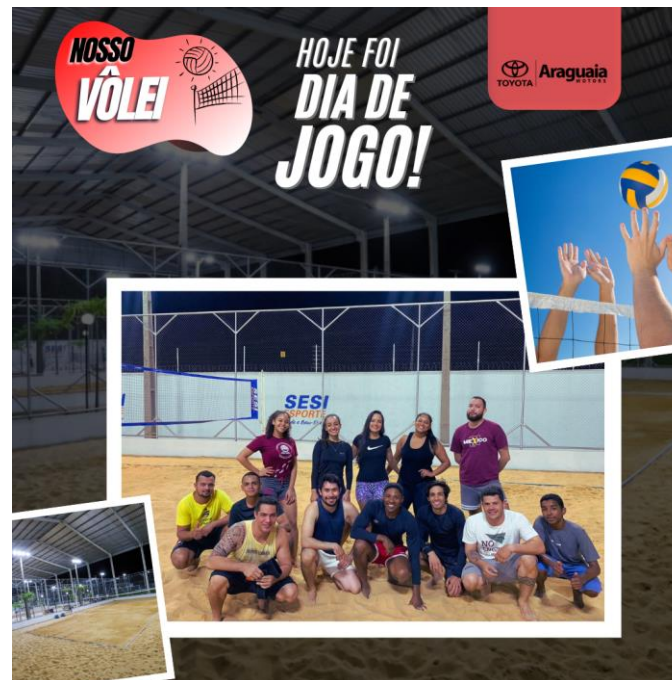
Divulgação dos colaboradores durante as partidas.