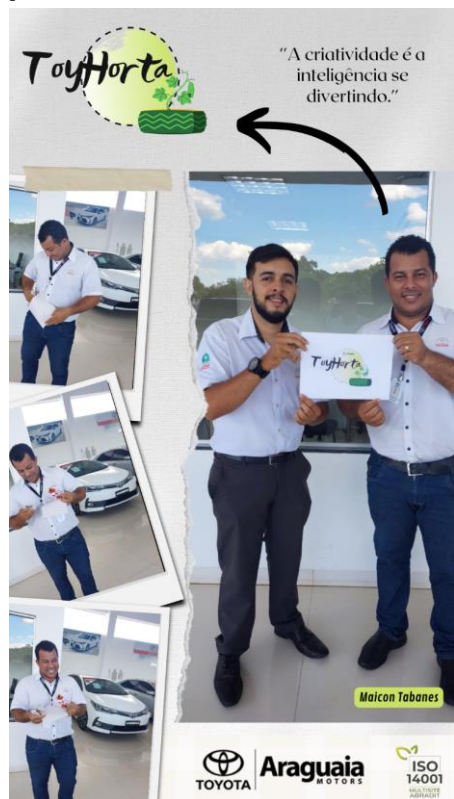
Fizemos campanha na loja para escolha do nome do projeto.