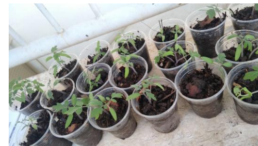
Nascimento das mudas que haviam sido plantada pelos colaboradores.