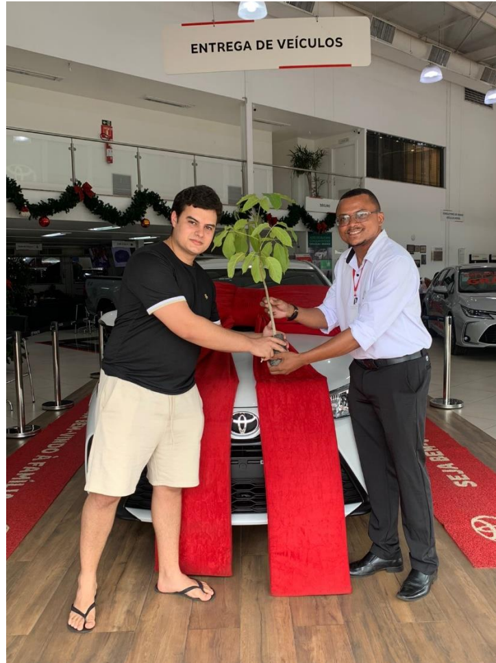
Cliente Pessoa Física